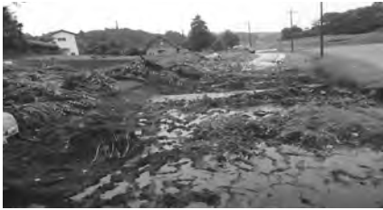
関東・東北豪雨(平成27年)で町内で起きた土砂災害突発的に何が起きても大丈夫な財政運営を期待する