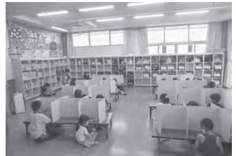
新型コロナウイルス対策学童 保育所特別開所事業費 決算額 229万円

健康診査、がん検診を実施し、胃がん検診864名、肺がん検診1726名、大腸がん検診1694名、子宮がん検診983名、乳がん検診1518名、骨密度検査680名など、多くの方が健康を意識され健診を受けています。