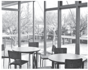
エコ・ハウス談話室