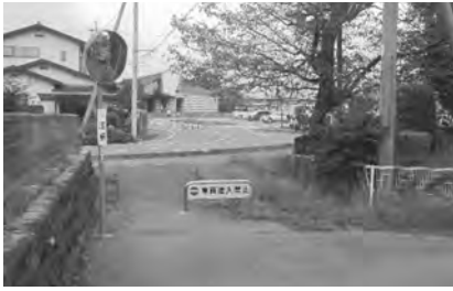
北区から駅東口道路

警察署の見解は、歩行者等の対策を道路管理者が十分に行えば問題がないとのことなので、車の流れや、道路の高さ、技術的な課題、財政の関係を含め、整備の可能性を検討する。