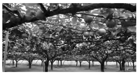
異常気象の影響を大きく受けた梨農家