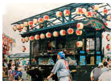
歴史を感じる天神坂の山車

祭りは、「無病息災、安全」を祈る場所として、寺院、神社、神宮などに鎮守の神を祀ったものや、「五穀豊穣」を祈りその神を祀ったものもある。例祭は、夏期に年中の一大行事として、盛大に行われ、従来の慣例を忠実に継承されているものも数多いが、現代風に簡素化されたものもある。祭礼では、笛、太鼓で賑やかに祭囃子が演奏されるようになり、やがて花屋台ができ、各地域で豪華な彫刻屋台が競って作られ、町中を引き回されるようになった。