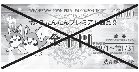
昨年度発行されたプレミアム商品券 今年度の発行はされない

町は、地域での消費拡大以前に、事業者を存続させることが肝要と判断し、制度融資に特化している。