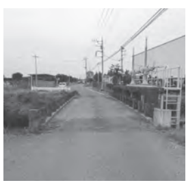
安心して渡れる橋に

事業名 砂部工業団地の北側を走る町道421号線の橋が老朽化し、架け替え工事をを行います。 工事名 橋架替更新工事その1 請負金額 7293万円 請負業者 (株)アライ実業 工事期間 令和2年9月14日～ 令和3年3月10日