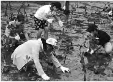
昨年の海外派遣(フィジー)でのマングローブ植樹