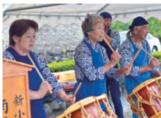
にぎやかな気分をかきたてるお囃子

西小学校の開校も記念され、8月上旬、現在のなかよし公園でこの祭りの前夜祭が開催され、屋台5台、お神輿15基が集められ約2万人の観客で賑わった。8月14日には「盆踊り・花火大会」が行われ、この年の夏は町全体がお祭り一色に染まり、活気に満ちていた。