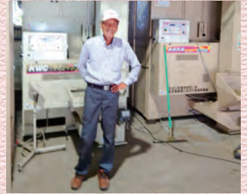
乾燥調整中「たくさんとれるかな?」