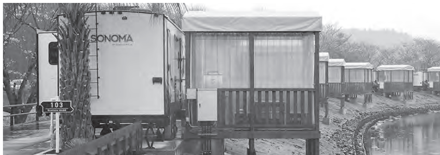
元気あつぷむら整備に係る経費 (平成30年度より繰り越された経費含む) 決算額 8億9860万円

新型コロナの影響で、学校が臨時休校となり、学童保育を臨時に午前中のみ開所し、子どもたちを預けられる環境を整えました。