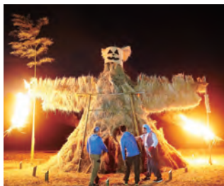
存在感のあるたんたんポッチ

モニメントの「たんたんポッチ」を主体に、多種多様な演出や模擬店、そしてクライマックスには、秋の澄んだ夜空に花火が打ち上げられ、盛大に行われている。