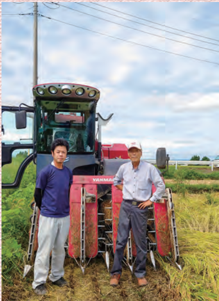
後継者との2ショット