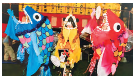
盆踊り大会でのユニークな仮装