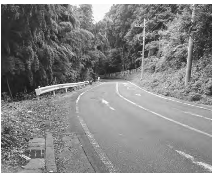
国道4号に通じる「御幸」 拡幅予定の都市計画道路南通り