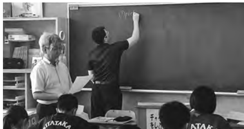
フェイスガードをしての英語の授業 (北中)

本来であれば、現場に直接伺い、実態を把握することが望ましいが、新型コロナウイルス対策を実施しているため、現地調査は行いませんでした。