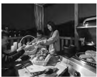
人気の高まっているグランピング

経営状況は、コロナの影響で厳しいが、直売所売上は平成30年度との比較で、6月から約20%増の売上で推移している。宿泊は、8月・9月の週末は予約で埋まり、利用者は増えている。