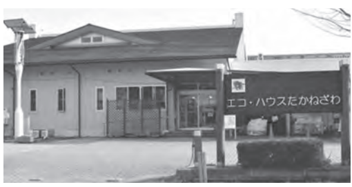
新たな時代の循環型社会にどう取り組むのか

事業名 砂部工業団地の北側を走る町道421号線の橋が老朽化し、架け替え工事をを行います。 工事名 橋架替更新工事その1 請負金額 7293万円 請負業者 (株)アライ実業 工事期間 令和2年9月14日～ 令和3年3月10日