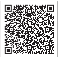
インフルエンザ 予防接種 QRコード