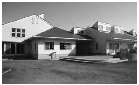
新園舎建設後に取り壊される現園舎