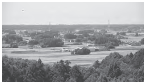
本町の豊かな田園環境

本計画に基づく田園環境の保全に配慮し、農業生産向上や、生活利便性の向上に繋がる道路整備などを想定している。