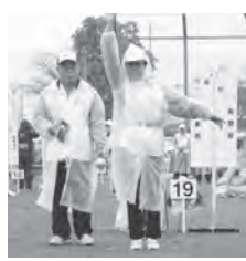
本町で行われたねんりんピック2014ペタンク大会

事業名 町民広場陸上競技場 改修工事 契約金額 2億1989万円 請負業者 (有)小宅建設 工事概要 ・雨水排水設備排水工事 ・クレイ舗装復旧工事 ・芝復旧工事 工期 令和2年9月14日～ 令和3年6月28日