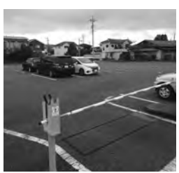
コロナの影響で利用者激減（駅東口駐車場）

管理委託契約は、運営上の売り上げ見込みを差し引いた額で管理料を設定しており、コロナによる減収分から、人件費と光熱費の支出減収分を差し引いた額を補填する。