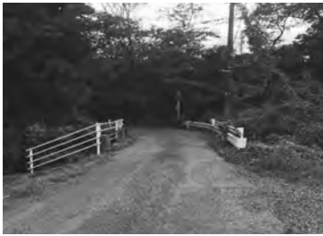
北区と石末を結ぶ道路

「短期整備路線」の整備の目途がついた段階で、「中期整備路線」の整備順位を決めて事業に着手したいと考えている。