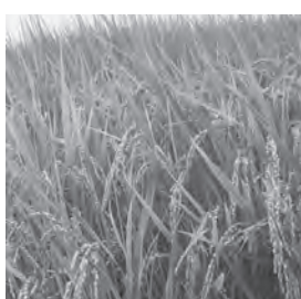
たわわに実る「とちぎの星」

4月17日に、感染症拡大防止のため「町主催の行事・イベントの開催自粛」を決定し、PR事業の実施延期も決定した。