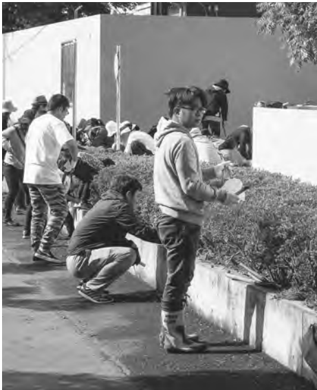
前年度の阿久津小PTAによる奉仕活動 子どもたちのために学校と保護者が理解し合う

学校運営・管理に係るものは「公費」、個人が所有・使用するものは「私費」と定義されるが、物品ごとに区分はできず、どのような目的で、どの様に使用されるかで判断するものと捉えている。 負担区分を明確に分けた一覧表の作成は考えていないが、会計事務に携わる教職員を対象に、負担の定義や考え方の指導を行い、学校会計の適正管理を図る。