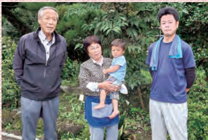
農作業が一段落の家族の一コマ

ソコソコにこなす事と、手を抜かない事が、最大の手抜きであることとを信条に作業に従事しています。