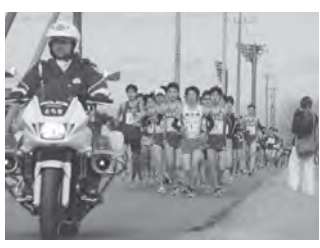
今年度中止となった「元気あっぷハーフマラソン」

一般会計補正予算で、感染症拡大に伴い中止した事業費の、約3000万円を減額した。減額は、既に実施している新型コロナウイルス感染症対策の財源として活用する考えである。