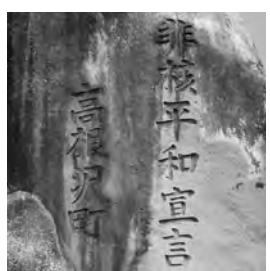
町民広場入口にある「非核平和宣言」の碑

本町では、戦没者遺族会のご協力で、中学2年生を対象に、「戦争体験講和」を実施している。