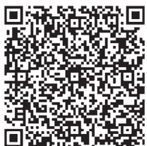
都市計画マスタープラン 概要版