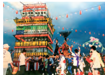
櫓（やぐら）の周りで舞う様子