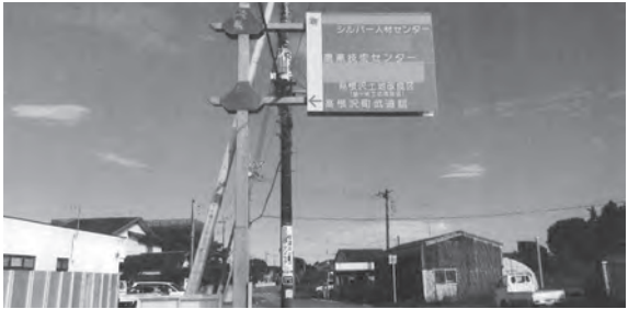
拡幅後の再設置はされない案内看板