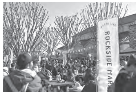
農産物加工品ブランド化 推進事業費決算額 325万円

今後、高根沢町のシンボルとして、どのように発展し、町民からも愛され、沢山の来場者が訪れる施設になるのか、民間経営の手腕に期待しつつ注視していきます。