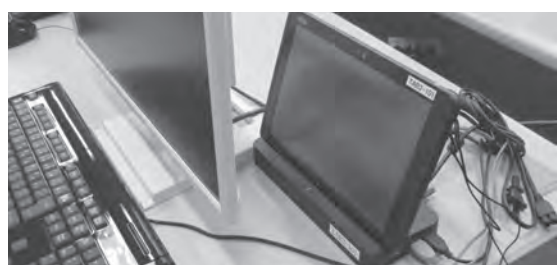
新しい時代の教育にはタブレットPCは必須

本町でも、「GIGAスクール構想」に基づき「高根沢町学校ICT推進計画」を策定し、令和5年度までに児童生徒1人1台環境整備を推進していましたが、新型コロナウイルス感染症拡大を受け、