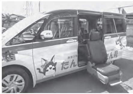
デマンドバス試験運行事業費 決算額 320万円

近年、学校を取り巻く環境整備として防犯というキーワードは外せません。安心して学べる学校環境を整えるため、全小・中学校に防犯カメラを設置しました。各学校は防犯マニュアルにのっとり、常に学校内の防犯チェックを行っています。