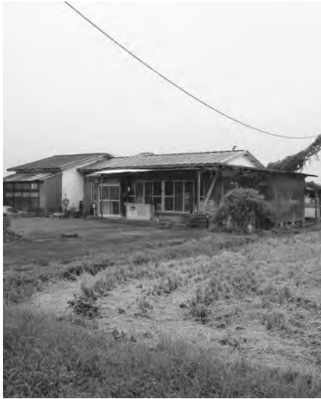
市街化調整区域内での空き家 建て替えるには宇都宮土木事務所へ相談が必要

「市街化調整区域内に長期居住する者のための住宅」や「市街化区域に隣接する等の既存の宅地における自己用住宅」などの開発基準を満たせば、所有者以外の方でも住宅の建築は可能となる。