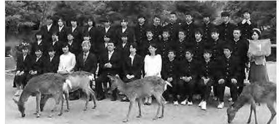
修学旅行にかわる代替案はないのか？ 写真：昨年の修学旅行（北中）