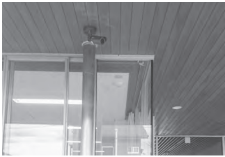
小中学校防犯カメラ設置事業 決算額 209万円

近年、学校を取り巻く環境整備として防犯というキーワードは外せません。安心して学べる学校環境を整えるため、全小・中学校に防犯カメラを設置しました。各学校は防犯マニュアルにのっとり、常に学校内の防犯チェックを行っています。