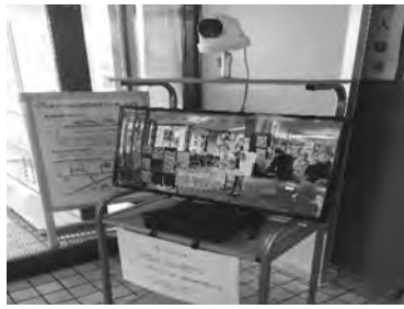
役場正面入口のサーマルカメラ

この他、新型コロナ感染症対策の経験から、自然災害などと重なり、避難を余儀なくされても、避難所が安心して運営できるように、備蓄品として欠けていたマスクを購入しました。