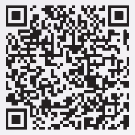
公職選挙法の改正概要 (総務省ホームページ)

そこで、選挙公営の対象を「市」と同様に拡大し、また町村議会議員選挙で、ビラ頒布が可能となります。 この対象拡大で、公費による負担が伴うこともあり、供託金制度を導入することを目的として行われました。