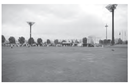
きれいになるグラウンドが待ち遠しい

事業名 町民広場陸上競技場 改修工事 契約金額 2億1989万円 請負業者 (有)小宅建設 工事概要 ・雨水排水設備排水工事 ・クレイ舗装復旧工事 ・芝復旧工事 工期 令和2年9月14日～ 令和3年6月28日