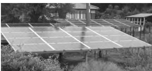
空き地に設置された太陽光発電設備、 周囲の景観への影響は？

に対し、自治体との協議や関係法令の整備などの対策を要望している。 本町は、この要望に対する国の対応を注視していく。