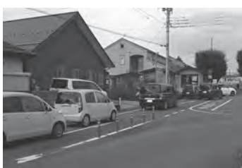
朝夕の混雑がひどい 「ちよっ蔵への道」

新型コロナウイルスの収束が見えない中ではあるが、本町の子ども達がこの苦境にも負けず、力強く歩んでいることがわかり、将来に向かい、更にたくましく成長し続けてくれることを、期待しています。