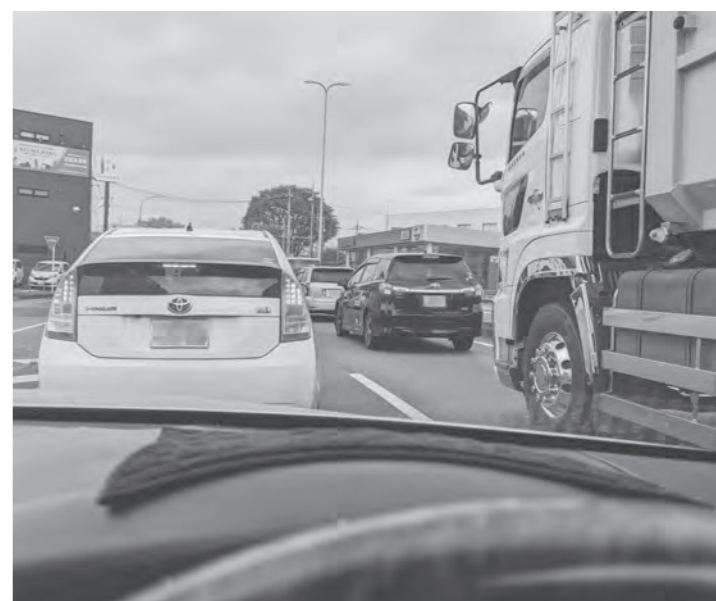
今朝も、人々の経済活動が始まる。