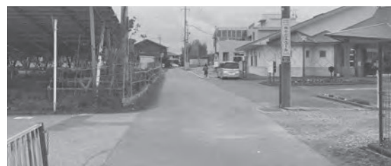
阿久津小学校東側道路にはあいさつ通り（12m）が計画されているが？