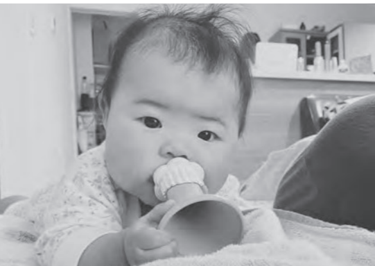
赤ちゃんは未来の宝物

A 町長 産科誘致については、 事業リーフレットを県医 師会、県内の医科大学に 加え、県内51の産婦人科 医にも送付し、周知を図 ってきたが、具体的な問 い合わせは得られていな い状況にある。 産科医の誘致について は、少子化に加えて医師 の負担の増大が、開設の 道筋を困難にしている状 況にある。 この課題に対して、国 に報酬改定や就労環境改 善などの処遇改善を図り、 産科医師の確保に取り組 んでいただくよう要望を したところである。 金融機関との情報交換 の中で、医療コンサルタ ントや医師に関心を持っ てもらったための訴えの改 善提案も示されているの で、今後も引き続き、粘 り強く産科誘致に取り組 んでいきたい。