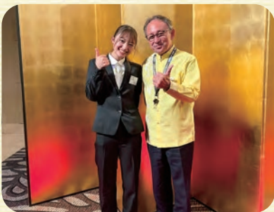
玉城沖縄県知事とともに

具体的には、元氣あっぷむらで沖縄物産展を開いたり、宮古島や沖縄本島で水産加工やヤギ農園での作業などで、地元の方たちとさまざまな交流を通じた活動を行っています。