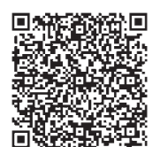
第419回定例会 くらしづくり 委員長報告全文