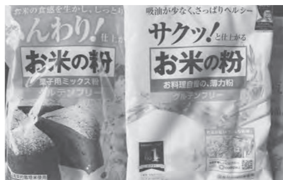
マーケットの注目を惹く米粉製品

そのため、地域が一体となった保全管理の体制づくりに向け、多面的機能支払交付金制度を活用した保全活動の広域化についての調査研究、関係機関との協議、農家との情報共有などを次年度以降進めていく。