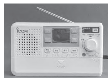
防災無線戸別受信機

自治会の活動は、行政が指導・主導するものではない。地域の方々の期待を受けて、自治会事業の復活や新規事業の展開に取り組むことは、まさに自治会の活動そのもの。町は、5類移行後も、自治会活動に寄り添いながら、継続して側面的支援に取り組む。