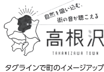
タグラインで町のイメージアップ!

んでおり、大学生の協力を得て若者の視点から調査研究し、本町の効果的なブランドイメージを構築していく。