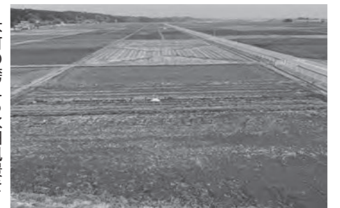
本町の誇れる水田風景を守りたい

この懇談会では、地区ごとの担い手数や集積状況などの情報を提供し、「見える化」した集約図を確認、地域農業の状況を共有し、土地改良事業についての現状、考え方、補助内容などを説明した。