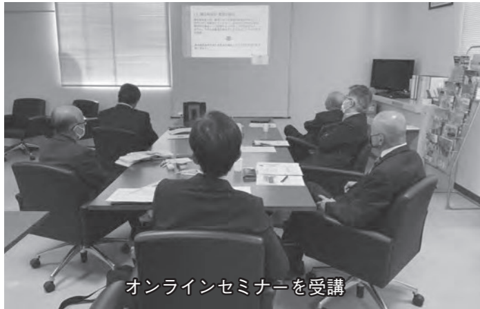
オンラインセミナーを受講

1. 調査の目的 町民の代表として議会のあるべき姿や議会基本条例の基本理念・位置付けなどについて協議し、議員としての資質や政策形成能力の向上や町民への発信力の強化につながるものを作成していきます。 2. 調査内容 ①オンラインセミナーを受講し、他自治体の例を参考に条