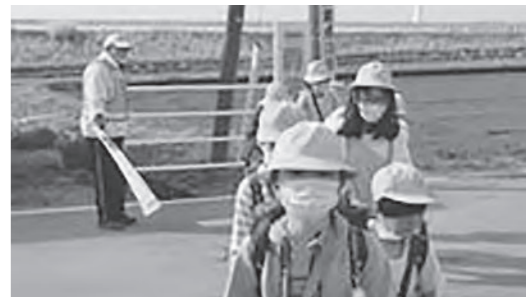
目線にはいつも子どもたち

Q 本町は、不妊治療 費助成や18歳まで 医療費の無償化などの取 り組みが見られるが、よ り子育てにやさしいまち としての「プロモージョ ン事業」に取り組むこと が、安心して産み、子育 てができる町に繋がると 思うが、今後の方針につ いて当局の見解を求める。 A 町長 町では子どもが健やか に育ち、学び、安心して 子どもを育てることがで きる社会の実現を目指し、 まち全体で総合的に子育 てを支援している。