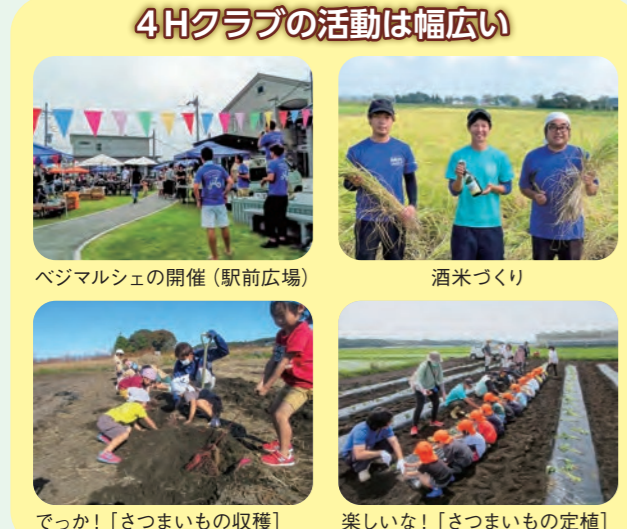
4Hクラブの活動は幅広い ベジマルシェの開催（駅前広場） 酒米づくり でっか！[さつまいもの収穫] 楽しいな！[さつまいもの定植]