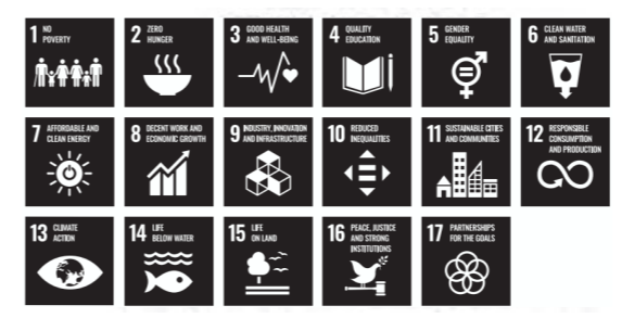
SDGsとは、2030年までに持続可能でよりよい世界を目指す国際目標です。17のゴール・169のターゲットから構成され、地球上の「誰一人取り残さない」ことを誓っています。

当初予算は、SDGsの理念のもと、町の未来を左右する大切な「今」と位置付け、地球温暖化に歯止めをかけるため、脱炭素ビジョンを策定し、カーボンニュートラルへの取組を町民の皆さまと推進していくこと、行政のデジタル化や災害時の防災拠点として、町民の暮らしが高まる庁舎整備を進めることを大きなテーマとして、新たな礎を築き上げてまいります。 さらに、「地域経営計2016後期計画」に掲げた「子ども・教育・生涯学習分野」、「健康・サポート分野」、「魅力・活力分野」、「環境・社会基盤分野」、「安全・安心分野」、「マネジメント分野」の目標達成に向け、今なすべきことを見極め、決断力を発揮して、まちづくりを推進してまいります。