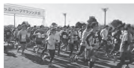
4年ぶりの開催となるか？元気あっぷハーフマラソン大会

本町の財政計画は、財政の健全性を保ちつつ、経済状況や社会情勢を勘案しながら見極めていく。今後、財源の根幹の町税は、生産人口の減少に