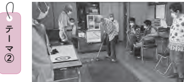
「わくわくサロン」でグラウンド・ゴルフミニゲーム(桑窪)