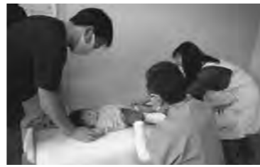
子どもは社会の宝です (1歳6か月児健診)