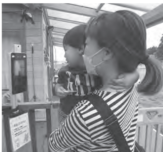
ママも体温チェック 安心して登園（のびのび保育園）

Q 保育園のクラスター発生による社会的影響が大きいことから、コロナウイルス感染症の早期封じ込めには、感染の有無を確認する検査の実施が必要であると考ええるか？