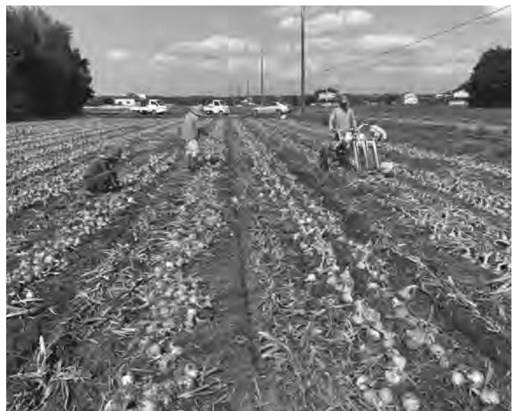
玉ねぎ栽培への転換が目立ってきています (花岡地内)