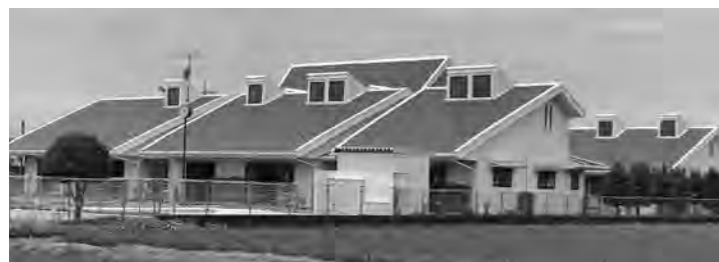
新たな園舎に高まる期待(ひまわり保育園)

Q 児童生徒多様性支援事業費で、学校支援員を配置することになった要因は。 A 児童生徒多様性支援事業費で、学校支援員を配置することになった要因は。