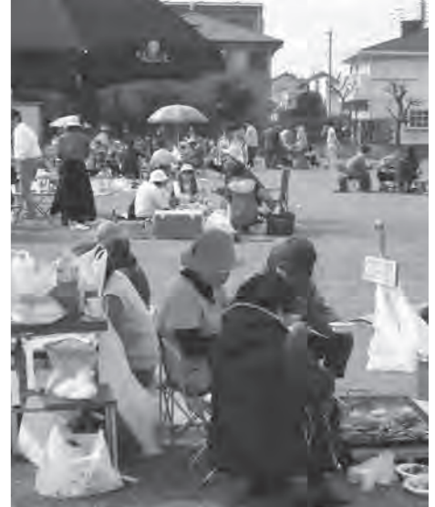
日ごろからの交流でいざという時も安心(光陽台自治会)