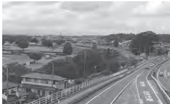
鬼怒グリーンパーク(左側)と国道4号