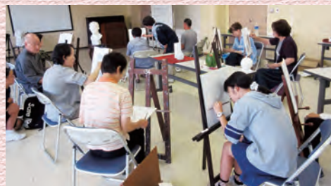
教室の仲間と切磋琢磨

日常のストレス発散にもなるし、生活の充実を感じています。絵画展に足を運ぶこともあり、楽しいです。