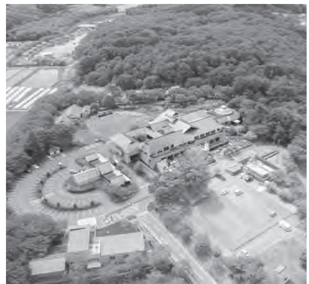
「いきたくなる場所」「ここにしかない空間」道の駅たかねざわ元気あつぷむら

修費用等についての補助メニューはないことから、新規整備が可能かどうか検討する前に、今後の元気があつぷむらの修繕にかかる町の費用負担など、町への財政負担の影響度合いがどの程度推移するのか精査することなどが優先課題であると考えられる。よって、国道4号沿線の道の駅の整備構想は、現在判断するには時期尚早である。