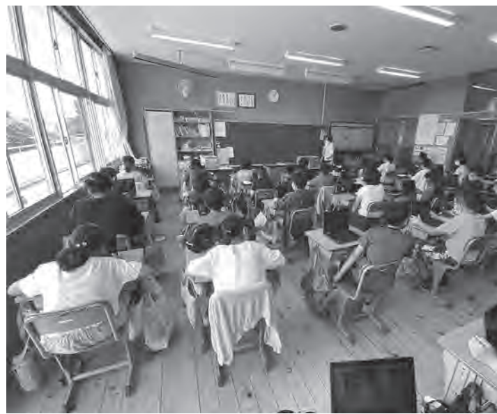
タブレットPCを用いた授業風景(西小学校)

テーマ設定の背景 今年度から、新しく設けられた2つの常任委員会のうち、教育・福祉・環境・防災などの事業を所管するのが「くらしづくり常任委員会」です。これらの事業における様々な課題について6名の委員で協議をしていくことになりました。 任期は2年で、他に「まちづくり常任委員会」があります。 具体的には、「学校運営に関すること」、「福祉の充実に関すること」、「未来に向けた環境に関すること」、「町民の安心安全に関すること」の4事業に関して、2年間にわたって調査・研究し、それらをまとめ、「よりよい暮らし」に役立つための提言を行います。