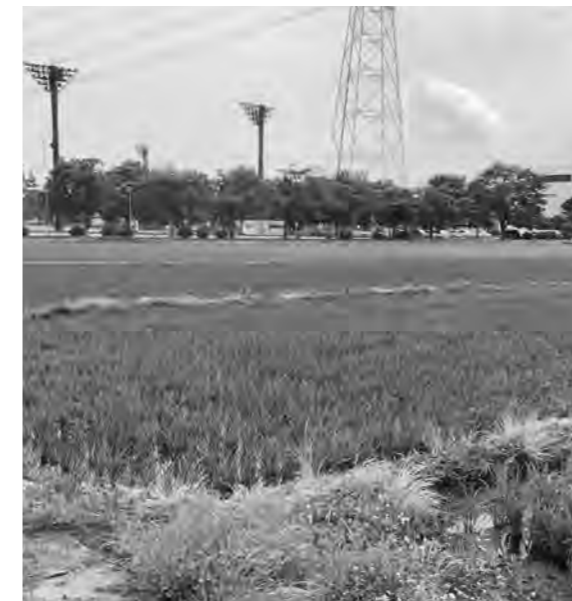
人口増加をめざした新たな町づくりを (町民広場周辺)

「高根沢町新庁舎整備検討委員会」の中で、ゼロベースから検討を進めているところである。あらゆる可能性を排除することなく検討していく中で、町民広場が候補地のひとつになる可能性はあると考える。