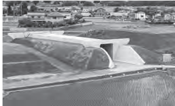
国道408号の国道4号への接続工事(グリーンパーク入口付近・宝積寺)