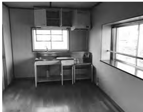
ひと時の安心をこの自宅で（町営太陽台住宅）