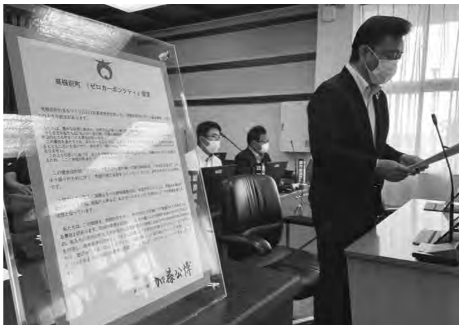
議場で「ゼロカーボンシティ」を宣言する加藤町長

この宣言によって、高根沢町は2050年までに、二酸化炭素排出ゼロの実現を目指し、脱炭素ロードマップを策定して、町内のあらゆる分野で脱炭素の取り組みを行うこととなります。