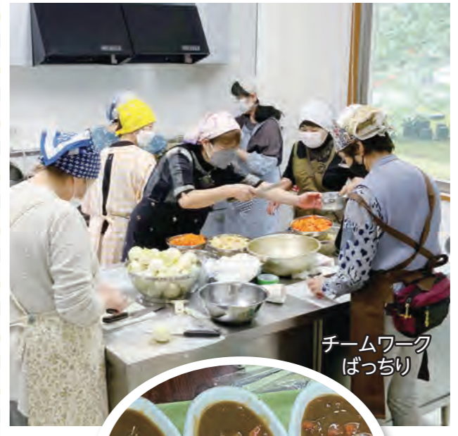
チームワーク ばっちり

最近、全国で活発な活動を見ているこども食堂。皆さんも、こども食堂に興味をお持ちではないでしょうか。本町でも、こどもも大人も、みんなで仲良く食事をし、イベントを楽しむ地域コミュニティを作りあげようと、「高根沢こども食堂プロジェクト」が組織されました。6月11日、エコ・ハウスたかねざわを会場に活動が始まりましたので、特集記事としてお知らせします。