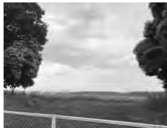
新工場建設が待たれるマニー敷地

啓発活動は、成人式での冊子の配布や、中学・高校への投票箱等の貸し出し、高根沢高校を訪問した「出前講座」を実施している。