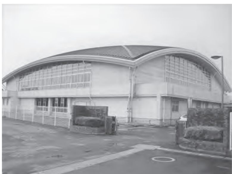
安心して長く使用できる体育館に

導入する費用に国から補助金が交付されます。94万円 マイナンバーカードは本町の交付率は、令和4年5月31日現在、44.5%で県内4位です。行政手続きのデジタル化が進むとマイナンバーカードが必要になるため、より多くの方に取得してもらえよう周知を図っていきます。 内容 北高根沢中学校屋内運動場の屋根や外壁等を改修する工事 請負代金 984.3万円 請負業者 潮田建設株式会社 工事期間 令和4年6月16日、令和5年1月31日